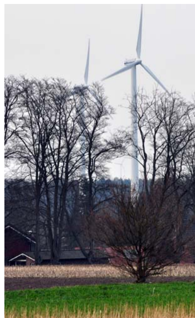
Windräder in Wallhöfen